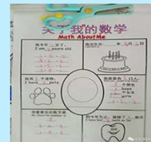
关于我的数学 少儿双语stem卡