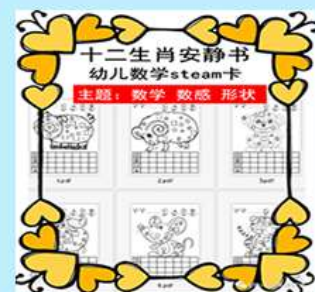
12生肖安静书 少儿数学stem卡