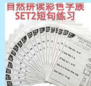
自然拼读第2阶段 sentence练习纸 单词到句子升级