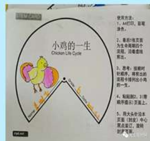
小鸡的一生 STEM少儿卡