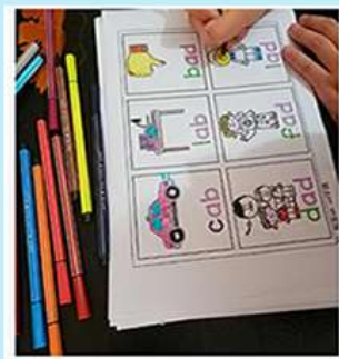
自然拼读第1阶段 海报 墙贴 桌贴 110个cvc单词点读