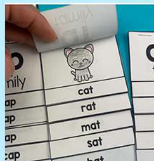
自然拼读第1阶段 flipbook手翻书 动手练拼读