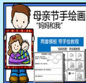
“妈妈和我” 母亲节STEM少儿卡