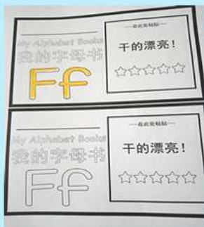
自然拼读预备阶段 26个英语字母音手翻书