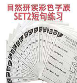
自然拼读第2阶段 sentence练习纸 单词到句子升级