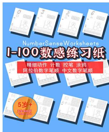
1-100数字启蒙 带中文小写数字