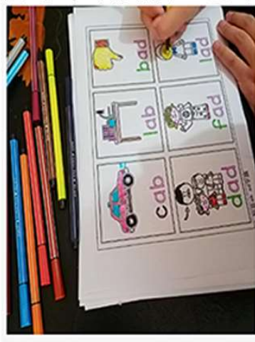
自然拼读第1阶段海报 墙贴 桌贴 110个cvc单词，带点读 网址