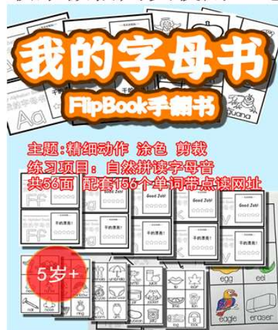
自然拼读学习第一阶段26个字母音 配套156个单词和图片，带点读网址