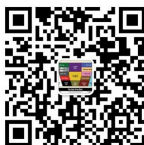
音标作业批改微信