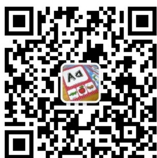
微信扫一扫听音频